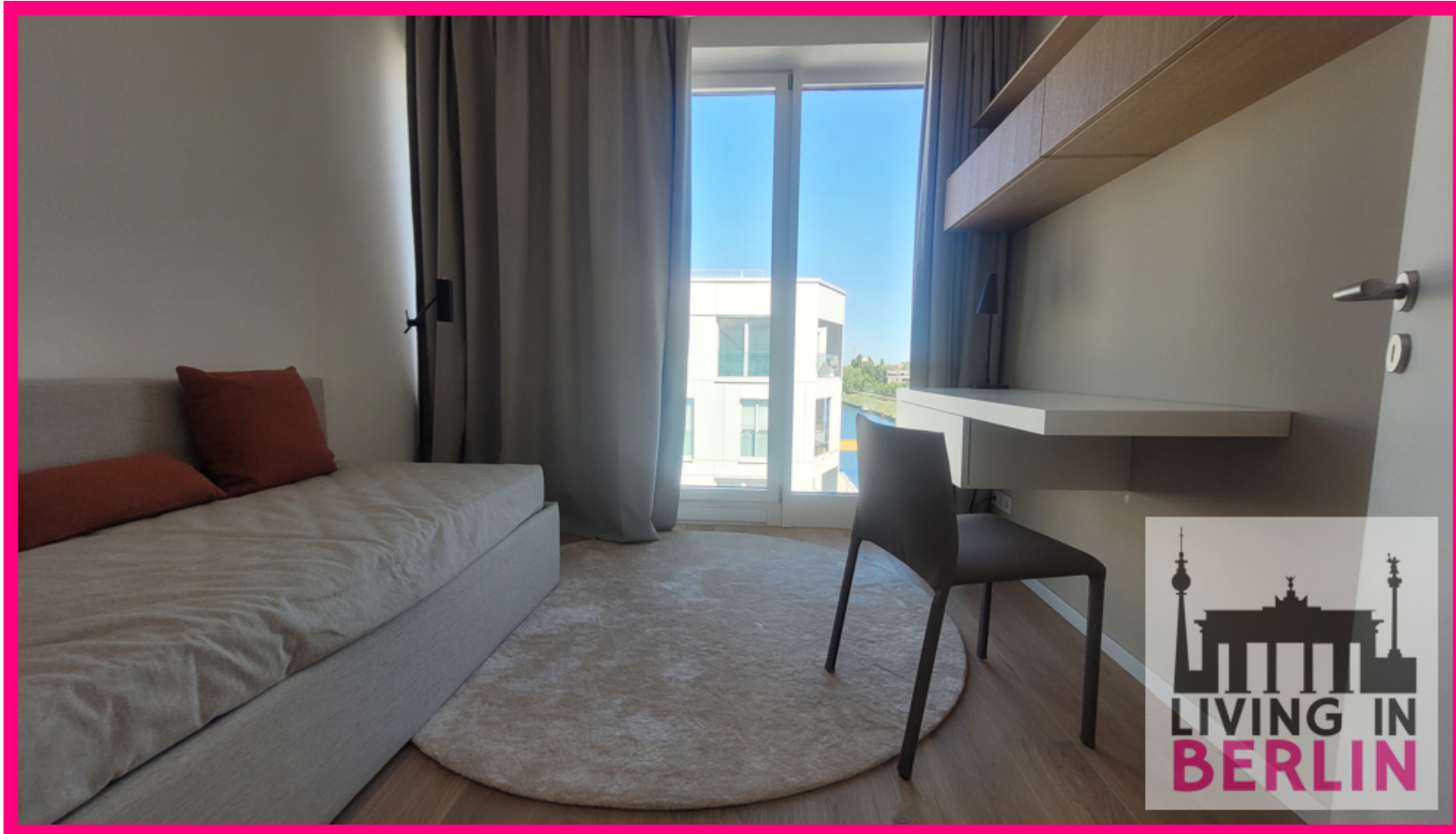
Gäste- und Arbeitszimmer