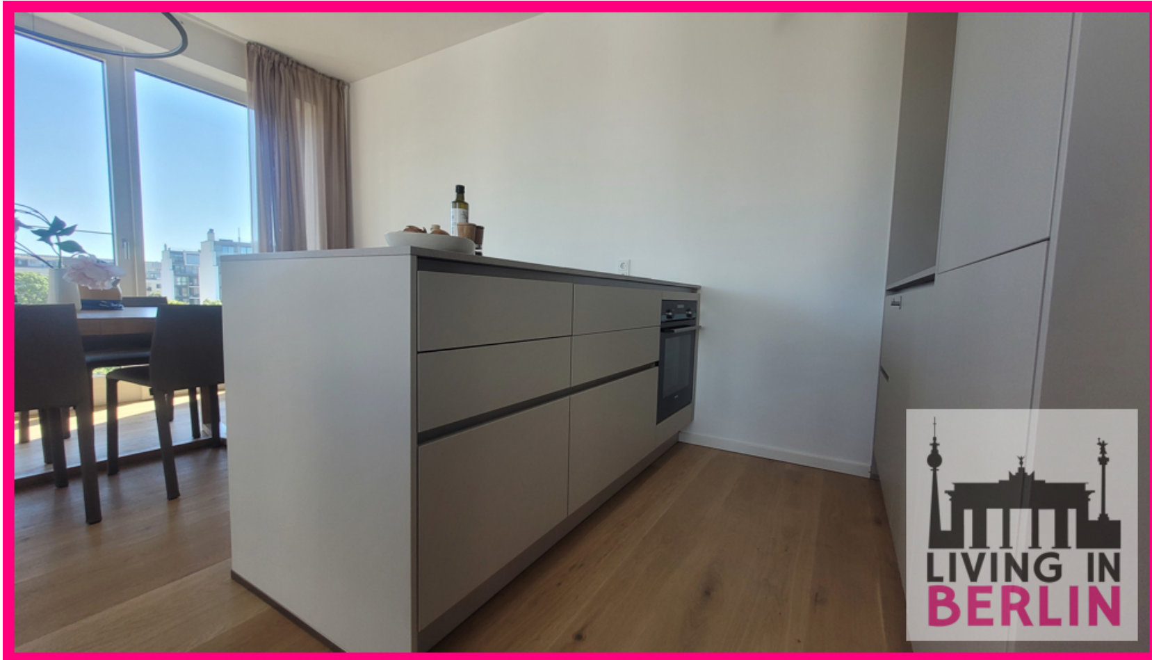
Küchenbereich mit Einbauküche