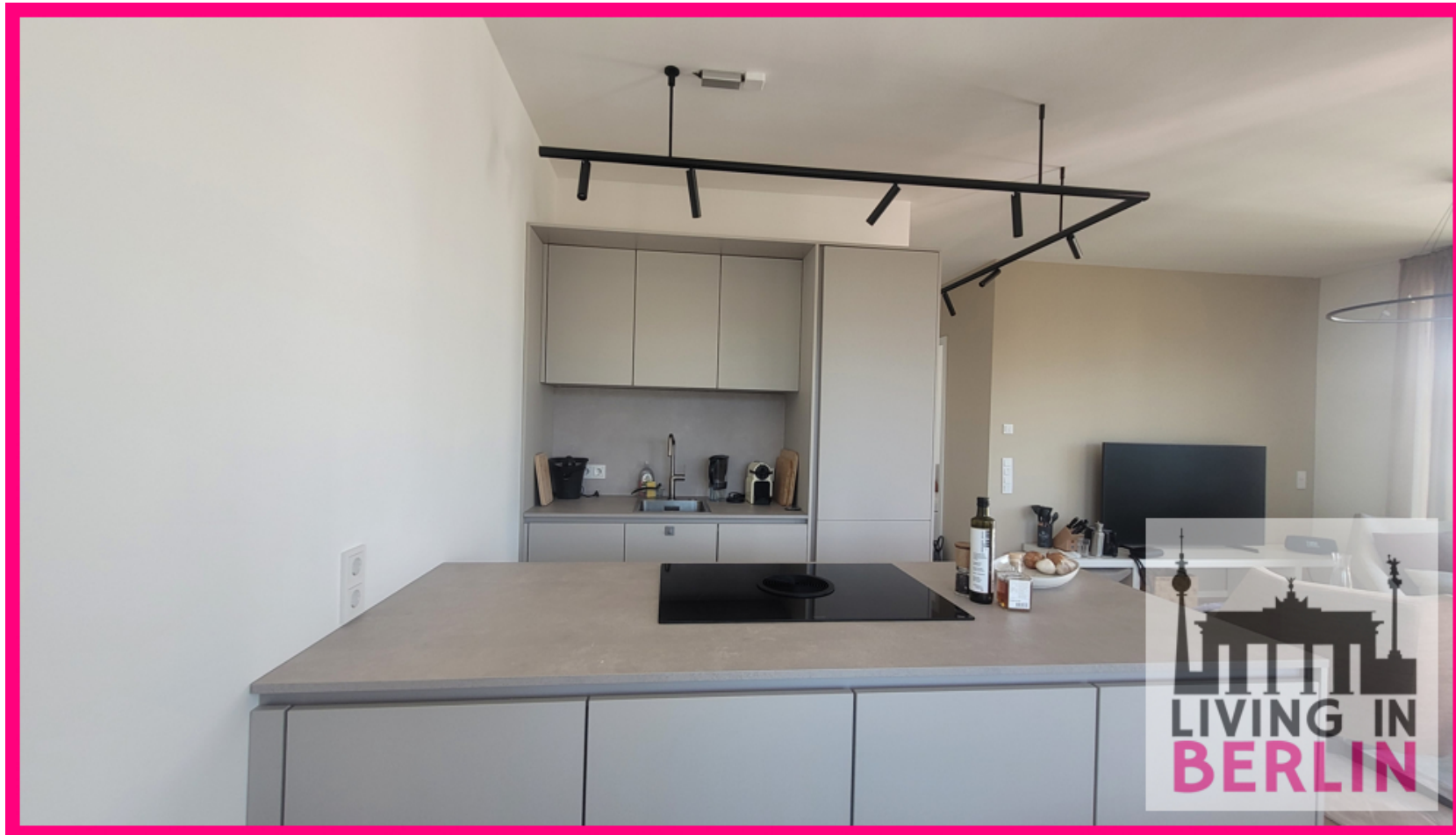
Küchenbereich mit Einbauküche