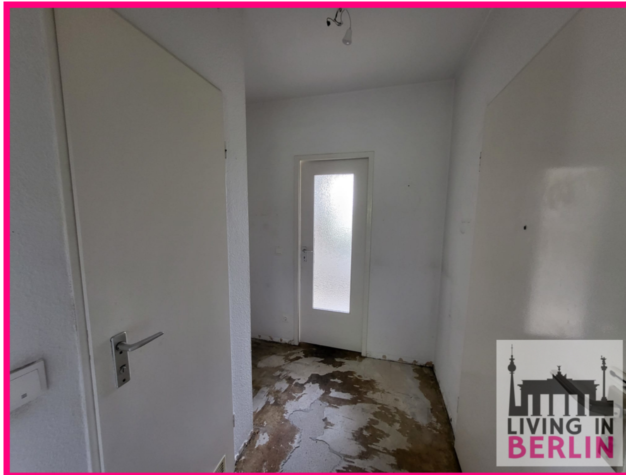
Flur unteres Geschoss