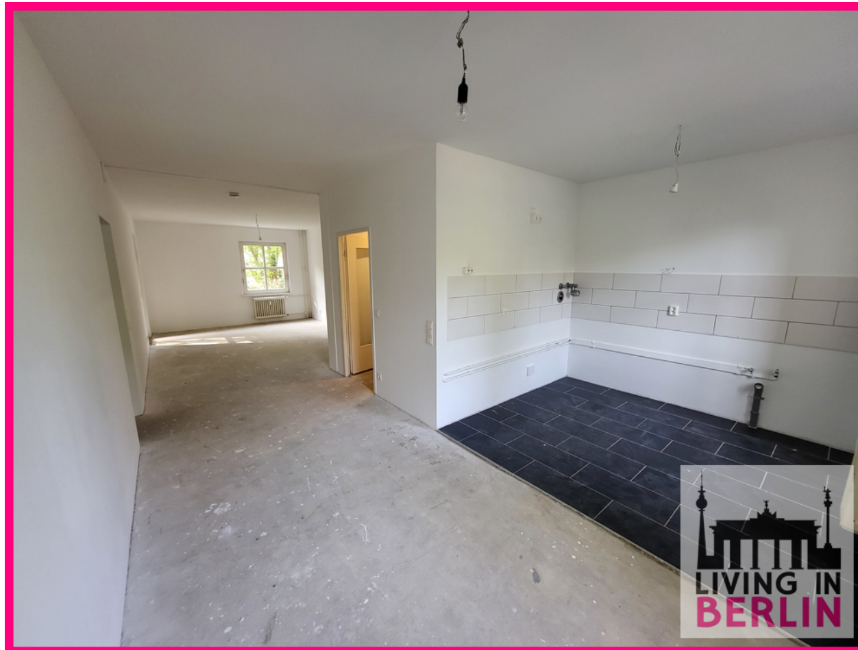
Küche und Essbereich