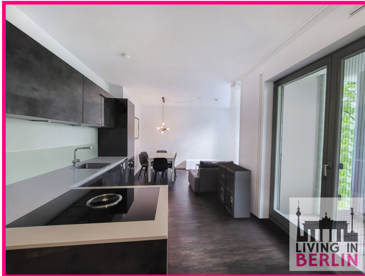
Blick in Koch- und Wohnbereich