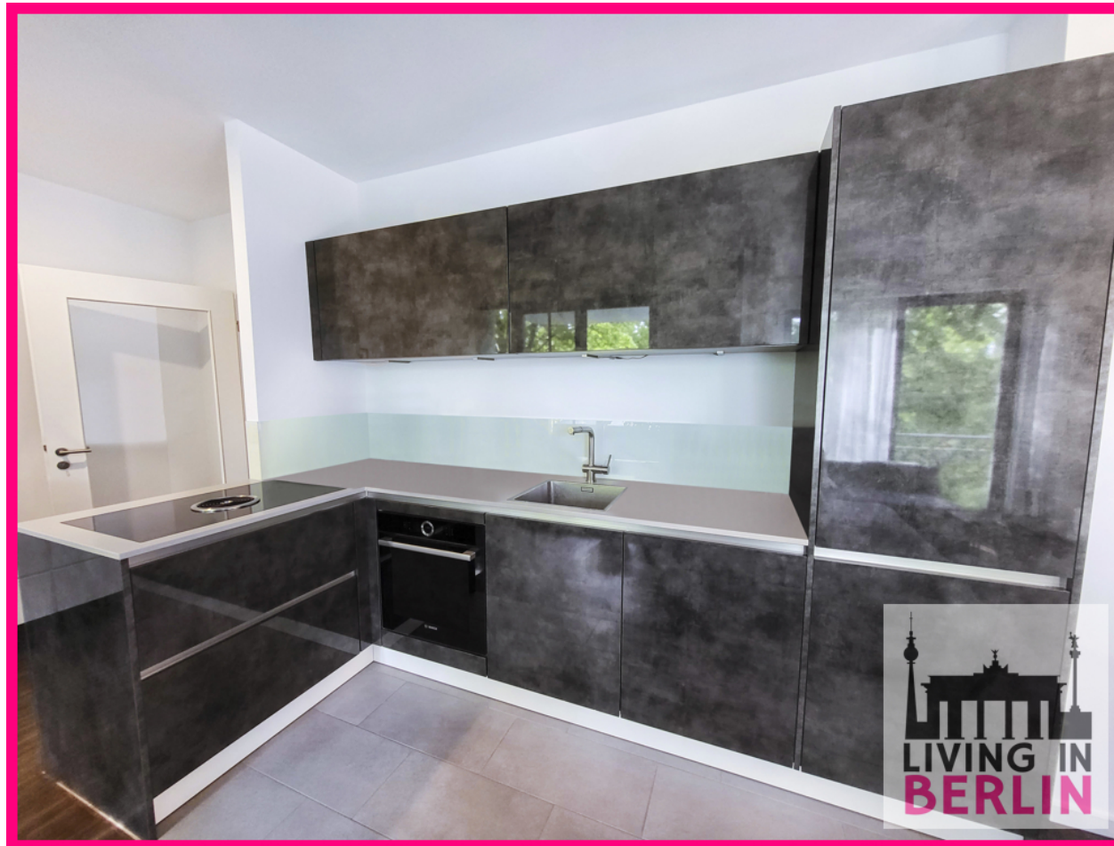
offene Küche mit Einbauküche