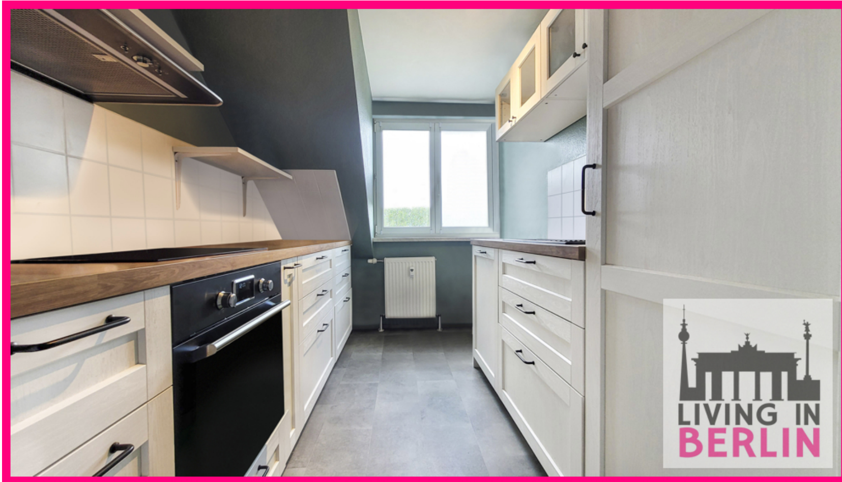
Küche mit Einbauküche